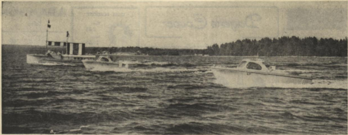
Rättning 25 meters lucka. Med ledarbåten i mitten forsar sjömätarna fram med 15 knops fart